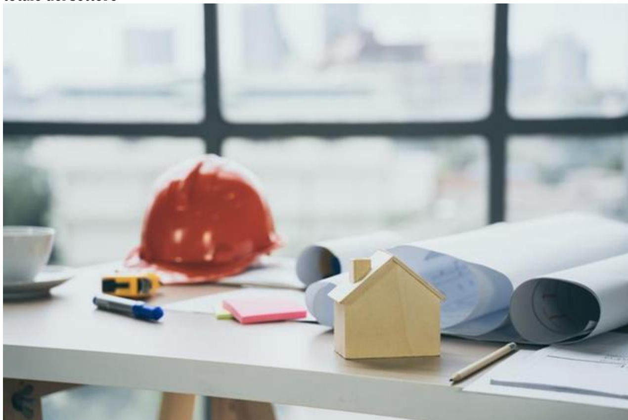
Immagine simbolo

Secondo l'associazione di categoria, le imprese dell'Isola si aggiudicano solo il 20% della spesa totale del settore