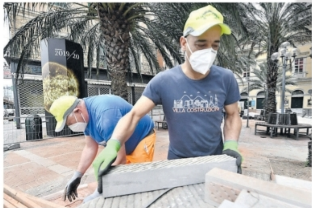
Due operai edili al lavoro in un cantiere

tavano più del 73 per cento del totale delle imprese di costruzioni (70,5 per cento la media nazionale), mentre alla fine del 2020 la percentuale è calata fino al 64,2 per cento (contro una media nazionale del 65,4 per cento). In crescita le imprese costituite in forma di società di capitali, che rispetto allo stesso trimestre dell'anno precedente fanno registrare 253 unità in più (+4,6 per cento), netto calo per tutte altre forme giuridiche. «In un mercato in profonda trasformazione occorre sostenere le imprese sarde nei processi di specializzazione produttiva, aggregazione, crescita dimensionale -